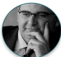
Antón Losada @antonlosada

Maestro y autor del blog de humor El Hematocrítico y el tumblr El Hematocrítico de Arte . Colaborador de Antena 3, Revista Mongolia y otras publicaciones. Autor del libro infantil Feliz Feroz .