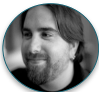
Eduardo Arcos @earcos

CEO y fundador de Hipertextual, la red de medios digitales más importante de Latinoamérica. Editor general de @ALT1040.